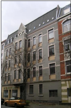
Rheinstr. 101 – Vor der Modernisierung

Wir bieten eine Beratung im Sanierungsgebiet an und wollen damit Eigentümer von Wohngebäuden dazu anregen, ihre Wohnungen und das Gebäude zu modernisieren und damit zur Verbesserung der Wohn- und Lebensbedingungen im Quartier beizutragen.