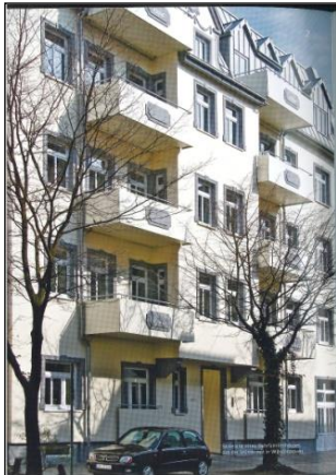
Nach der Modernisierung

Viele Häuser im Gebiet sind sanierungsbedürftig, haben aber den Charme der Gründerzeit, so dass sich (fast) jede Mühe zu ihrer Modernisierung lohnt. Da der Aufwand bei solchen Häusern besonders hoch ist, hat die Stadt Wilhelmshaven ein Förderkonzept entwickelt, das wir Ihnen mit diesem Infoblatt erläutern möchten.