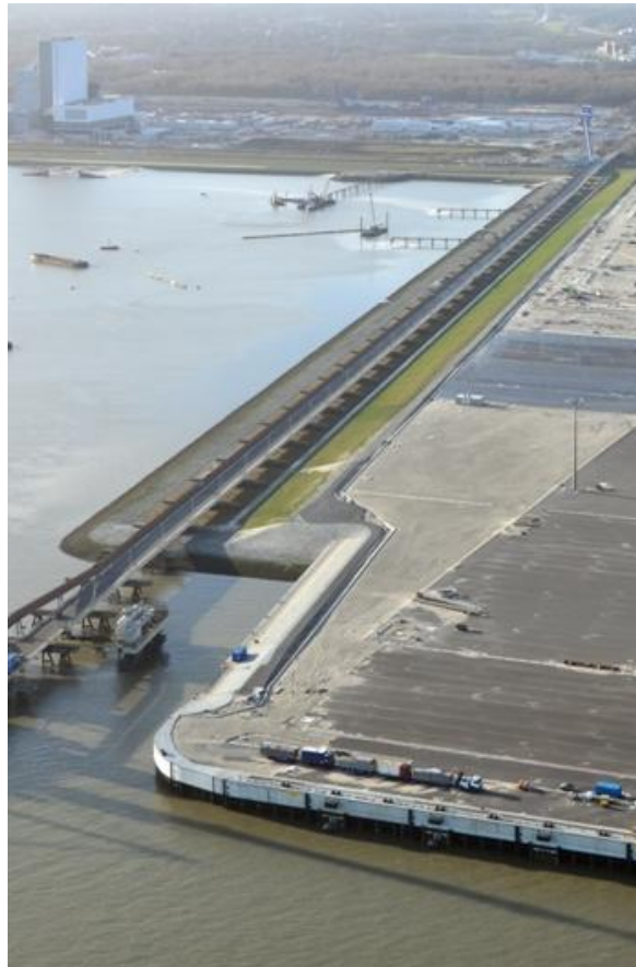
Einbindung der Niedersachsenbrücke in den Süd-Damm des JadeWeserPort