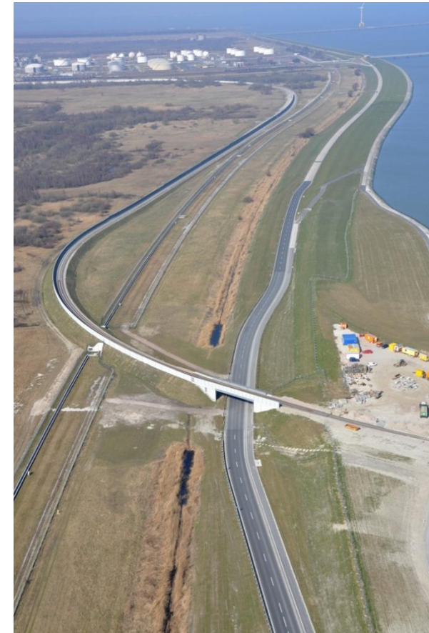
Bahnanbindung des JadeWeserPort