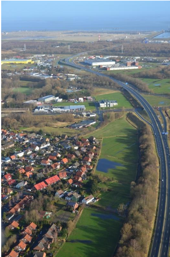
Weiterbau der A 29 bis in den JadeWeserPort