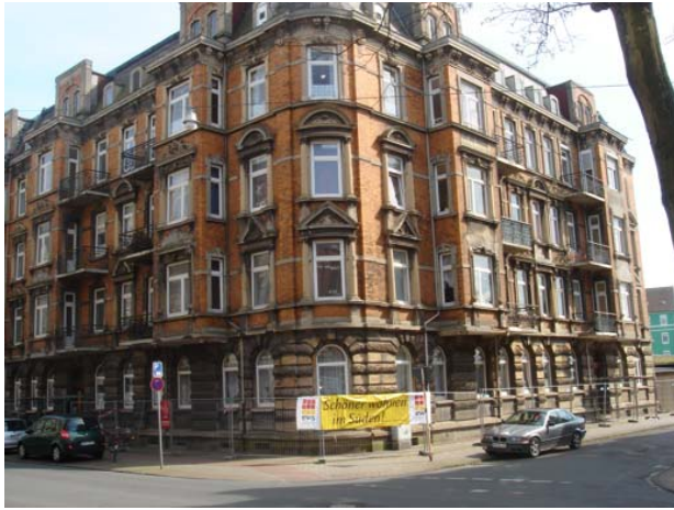
Weserstr. 116 / Kurze Str. 9

seit Beginn des Jahres 2007 hat die EWS Entwicklungsgesellschaft Wilhelmshaven-Südstadt mbH die Aufgabe des Sanierungsbeauftragten für die Stadt Wilhelmshaven übernommen. Wir werden die Beratung im Sanierungsgebiet ausbauen und wollen verstärkt Eigentümer von Wohngebäuden dazu anregen, ihre Wohnungen und das Gebäude zu modernisieren und damit zur Verbesserung der Wohn- und Lebensbedingungen im Quartier beizutragen.