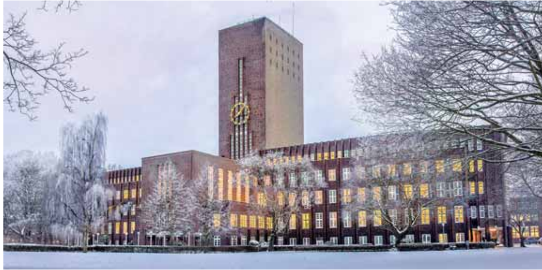
Das Wilhelmshavener Rathaus – im Volksmund auch „Burg am Meer“ genannt