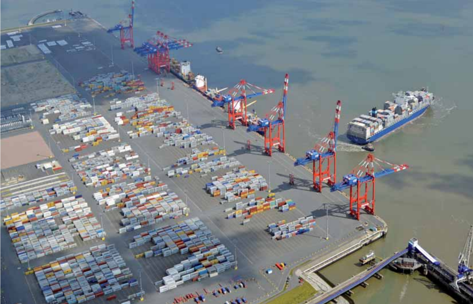
Die Maersk Stadelhorn beim Ablegen vom Container Terminal Wilhelmshaven