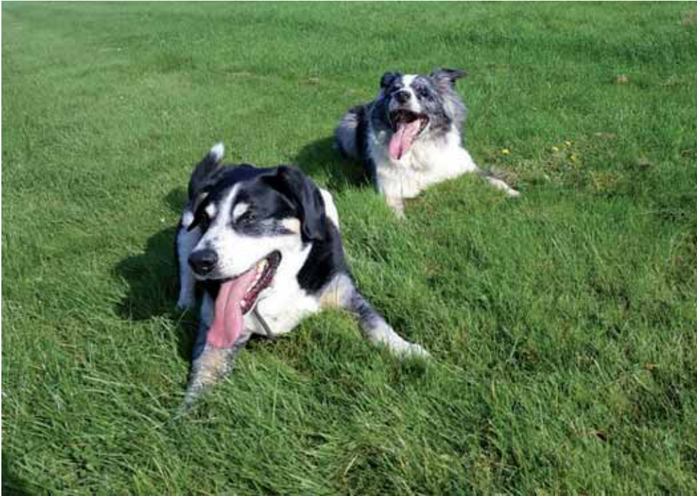
Auf zwei Freilaufflächen können Hunde in Wilhelmshaven ohne Leine herumtollen.

Hunde, Katzen, Kaninchen, Meerschweinchen, Vögel, Fische ... Rund 35 Millionen Haustiere leben in deutschen Haushalten.