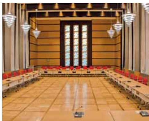
Moderner Ratsaal im historischen Bau des Architekten Fritz Höger

Seine Aufgabe ist es außerdem, Ratsentscheidungen vorzubereiten und umzusetzen. Der Oberbürgermeister ist die Schnittstelle für die Bürgerinnen und Bürger, den Rat, die Verwaltung, die lokale Gesellschaft und die Medien. Für die vielfältigen Repräsentationsaufgaben werden vom Rat ehrenamtliche Bürgermeister gewählt, die den Oberbürgermeister bei seinen Aufgaben vertreten.