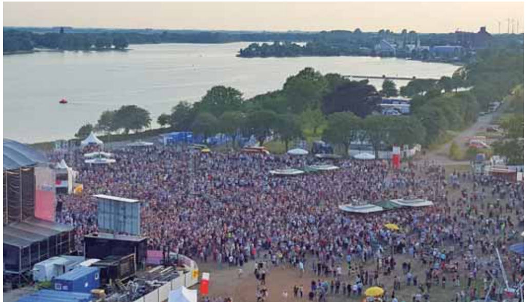
Wilhelmshaven bietet traumhafte Kulissen – auch für Open Air-Konzerte.

Tourist-Information in der NordseePassage, Obergeschoss Ebertstraße 110 Öffnungszeiten: Mo. – Fr. 10.00 – 18.00 Uhr Sa. 10.00 – 16.00 Uhr www.wilhelmshaven-touristik.de