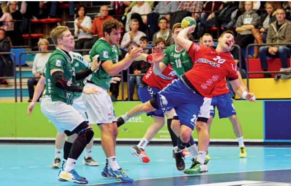
In Wilhelmshaven wird Handball gespielt: Hochklassig und spannend – wie hier von den WHV-Handballern.