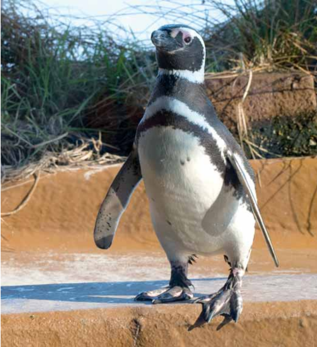
Dagobert, den putzigen Magellan-Pinguin, trifft man im Aquarium Wilhelmshaven an.