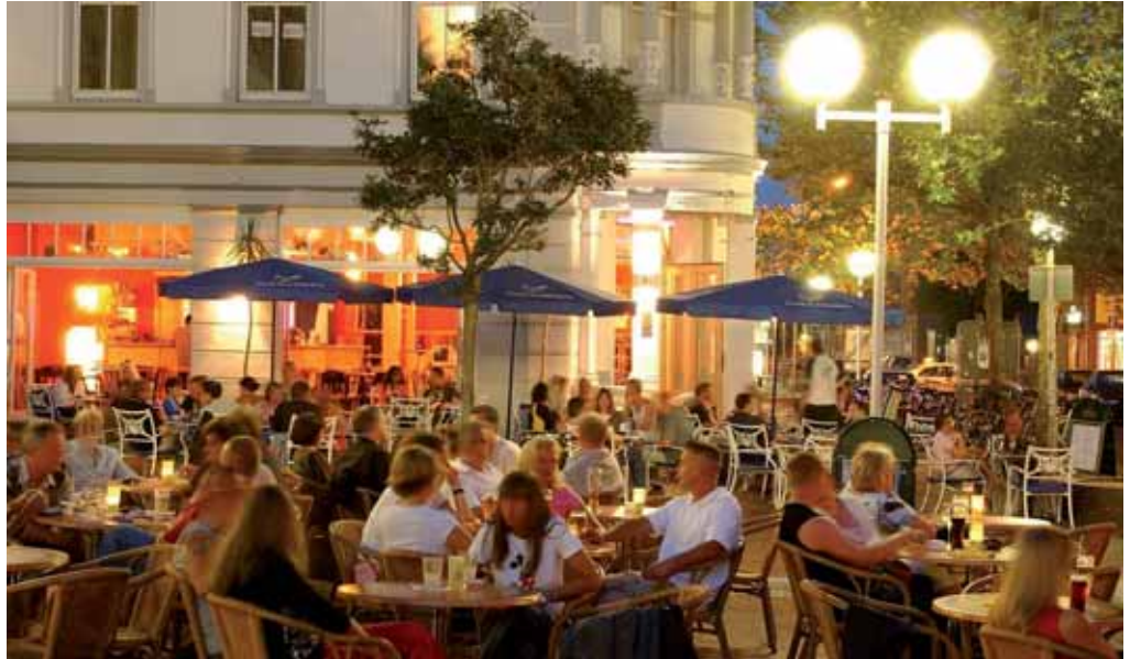
Nicht nur am Börsenplatz bietet Wilhelmshaven eine große Auswahl an Restaurants, Cafés, Kneipen und Bars, um oft und vielfältig auszugehen.

„Einmal lecker essen, bitte“ – in Wilhelmshaven hat man da die Qual der Wahl. Die folgende Auswahl kann und soll höchstens als „Amuse bouche“ gelten. Das Angebot reicht von bodenständig bis exotisch. Und da Wilhelmshaven eine Hafenstadt ist, gibt es den Blick aufs Wasser oftmals inklusive.