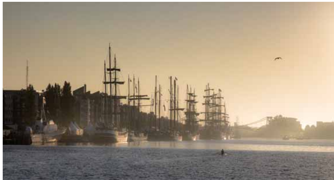
Historische Großsegler frühmorgens am Bontekai kurz vor dem Aufbruch zur Regatta