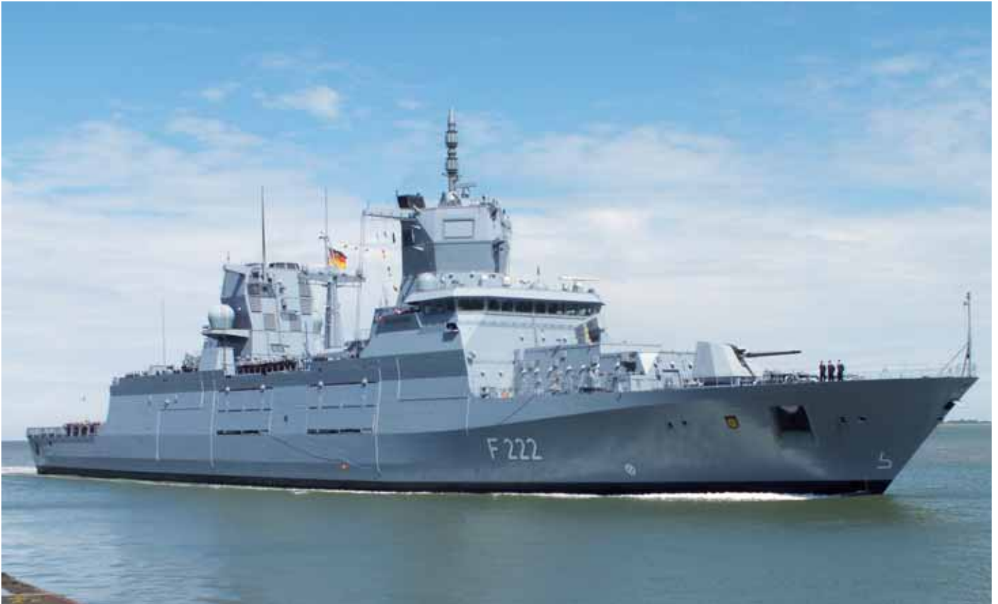
Die 149 Meter lange Fregatte „Baden-Württemberg“ F222 der neuen F125- Klasse der deutschen Marine