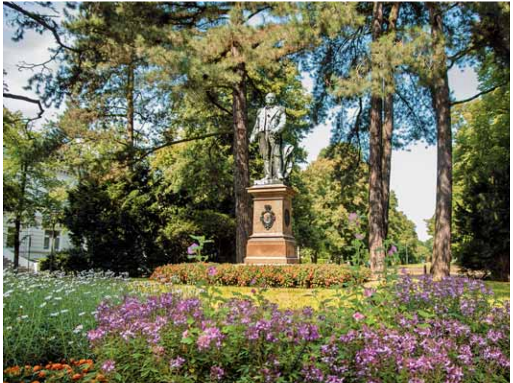
Friedrich Wilhelm Park

Wilhelmshaven bietet mit seinen zahlreichen Gärten und Parks eine Vielfalt an grünen Oasen, die dazu einladen, die Seele baumeln zu lassen. Wer einen ruhigen Platz abseits des Stadtrubels sucht, wird bereits unweit der Innenstadt fündig. Ob entspannt in der Sonne liegen oder eine gemütliche Runde spazieren gehen, all dies ist in den Park- und Gartenanlagen in Wilhelmshaven möglich.