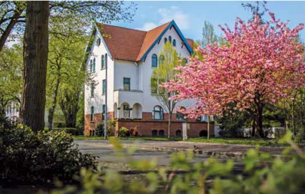
Typisch historisches Siebethsburg-Haus: Weiße Fassade, türkis-grüne Fenster und rotes Dach