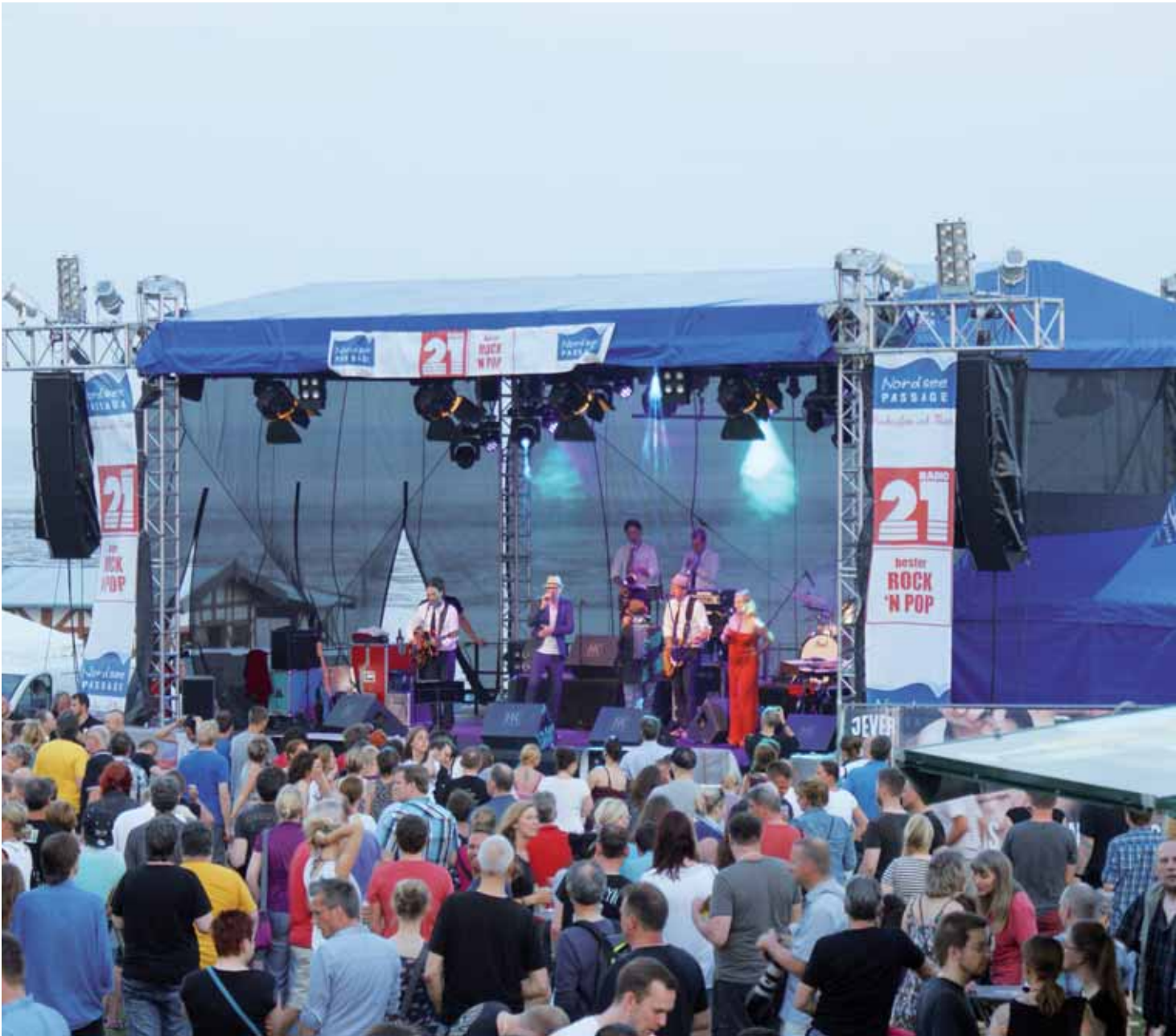
Das Wochenende an der Jade ist ein absoluter Besuchermagnet.