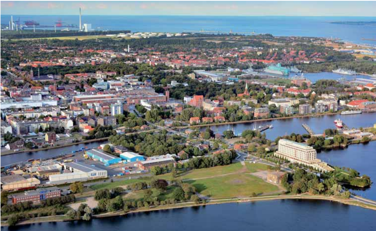
Arbeiten und Leben, wo andere Urlaub machen. Wer Neues starten will bekommt Unterstützung im Jade Innovationszentrum (Gebäude unten links)

ansiedeln und somit den gewerblichen Leerstand reduzieren. Hierfür bietet das Projekt eine Reihe von individuellen Beratungsmöglichkeiten in den Bereichen Finanzierung, Marketing und Unternehmensplanung. Durch diese Maßnahmen soll nicht nur die Südstadt ein besseres Image erhalten, sondern auch Wilhelmshavens Wirtschaft belebt werden.