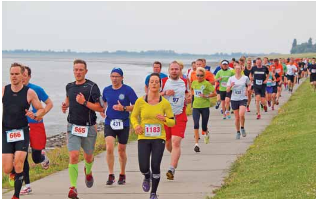
Entlang der Küste und über die beiden Brücken des Großen Hafens: Eine traumhafte Laufkulisse für mehr als 2000 Läufer beim jährlichen Gorch-Fock-Lauf.

Wilhelmshaven ist eine sehr sportorientierte Stadt. Das liegt zum einen daran, dass die Auswahl verschiedener Sportangebote durch die vielfältige Landschaft breit gefächert ist und zum anderen an den Vereinen, die die Ausführung dieser Sportarten ermöglichen.