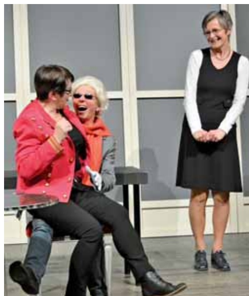
In der Theatergruppe für „Ältere“, den Silbermöwen der Landesbühne, mitmischen – nur eine von vielen Freizeitaktivitäten für Best Ager in Wilhelmshaven.

Sich noch einmal neuen Herausforderungen stellen und einen langgehegten Jugendtraum erfüllen – im Alter hat man plötzlich genügend Zeit, die sinnvoll genutzt werden will. Warum also nicht noch einmal studieren? Was im ersten Moment vielleicht komisch klingt, wird an deutschen Universitäten und Hochschulen mittlerweile immer beliebter. Viele ältere Bürgerinnen und Bürger entdecken den Spaß an der Bildung ganz ohne Leistungsdruck. Ob als Gasthörer oder Teilnehmer eines „Studieren-im-Alter-Programms“: Wege zurück an die Universität oder Hochschule gibt es viele. In Vorlesungen und Co. kann garantiert noch Neues erfahren werden, denn man lernt ja bekanntlich nie aus. Information zum Thema Gasthörerschaft unter www.jade-hs.de/studieninteressierte www.uni-oldenburg.de/studium/studium-generale-gasthoerstudium