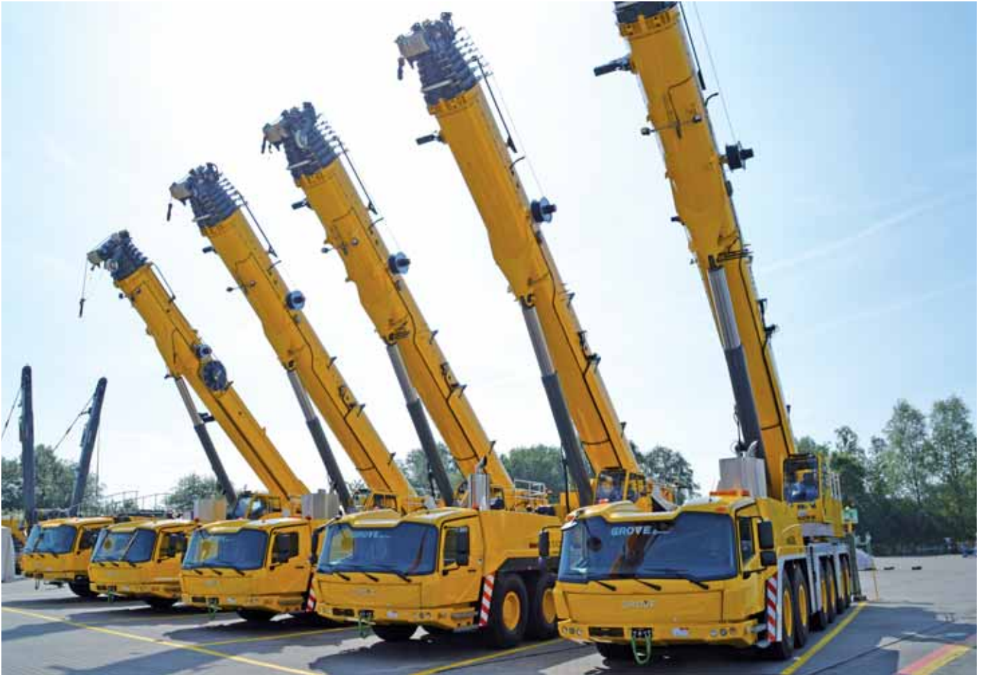
Kranparade der Manitowoc Crane Group