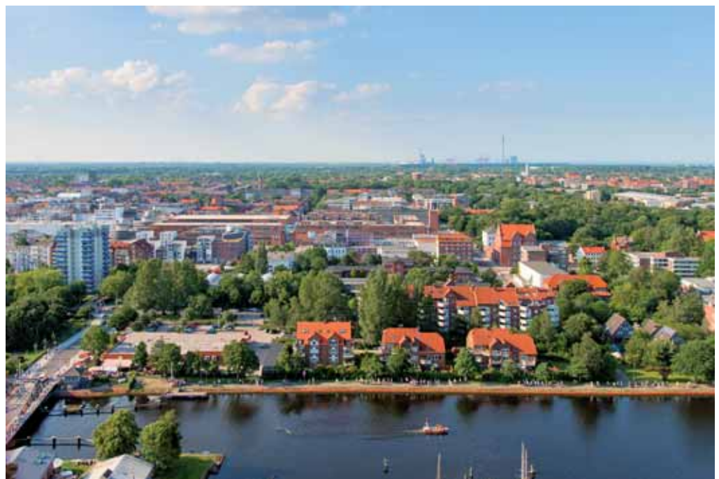
Die Innenstadt aus der Luft

Ganz authentisch erfährt man bei einem geführten historischen Stadtspaziergang, wie es sich zu Kaisers Zeiten lebte.