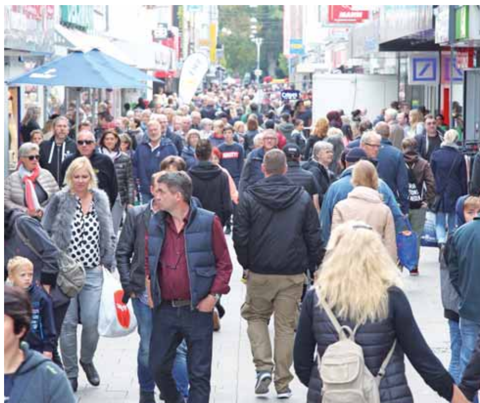
Die Fußgängerzone gilt als die Shopping-Meile in Wilhelmshaven.

Wilhelmshaven bietet mit seiner Innenstadt viele Möglichkeiten nach Lust und Laune zu shoppen, sich kulinarisch verwöhnen zu lassen oder wichtige Dinge auf dem Einkaufszettel zu erledigen. Zu der Fußgängerzone gehört die Marktstraße, alle anliegenden Straßen sowie die NordseePassage mit direktem Zugang zum Bahnhof und ZOB.