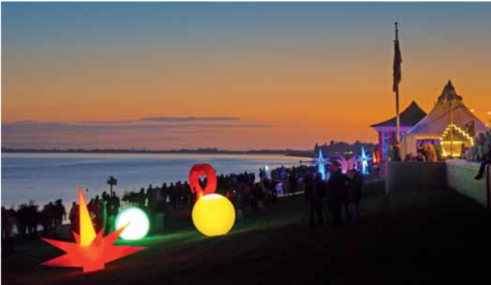
Das LichterMeer gehört zu den besonders stimmungsvollen Highlights für Einheimische und Besucher.